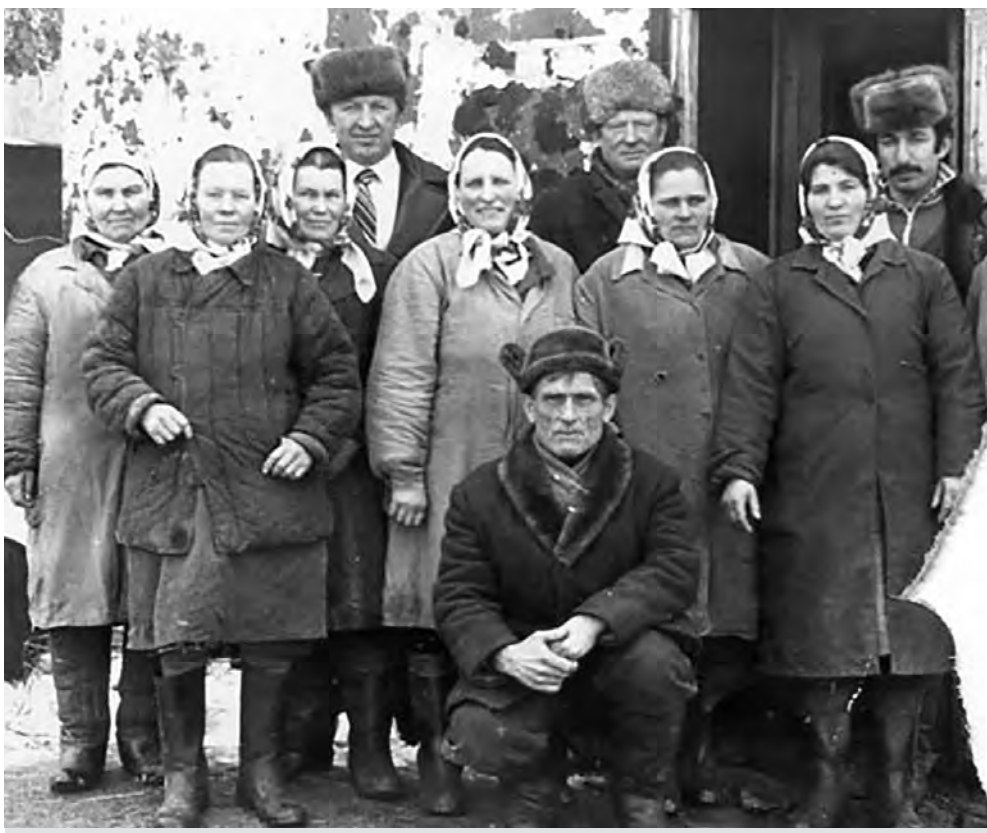
В колхозе Заря мира д.Коровино

(Окончание. Начало в № 41 от 08.10.2025г.)