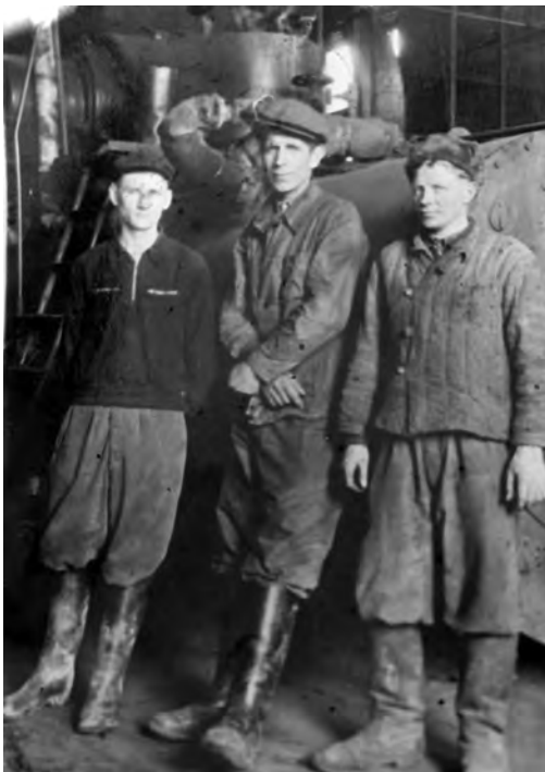
Кочегары Михайловского маслозавода. 1960-е гг.

Во время одного из них, у о.Сосновец, в январе 1942 г., бомбы попали в котельное отделение, разрушили палубу и котлы, погибли и получили ранения более 20 моряков. И всё же «Иосиф Сталин» выжил. Благодаря восстановлению 6 кот-