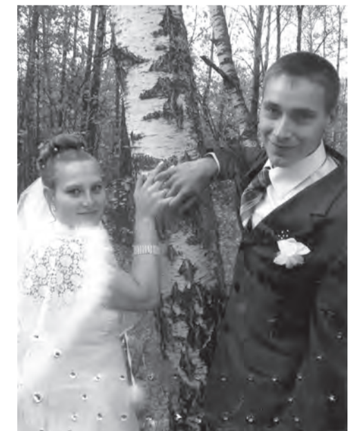
Счастливый день свадьбы