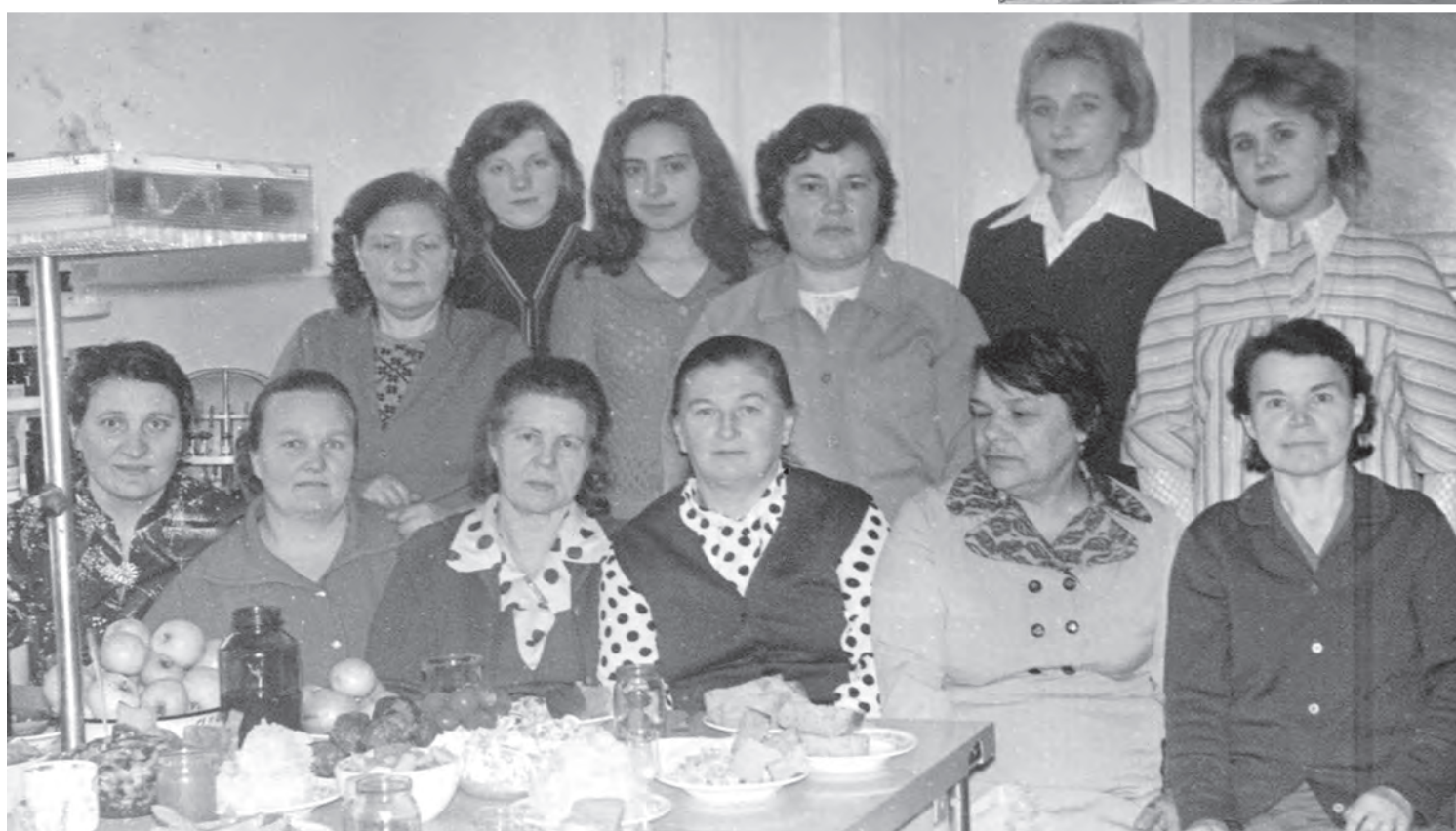
Коллектив Михайловской аптеки. 1980 г.