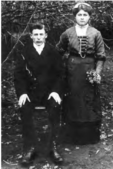
Арюпины дореволюционное фото