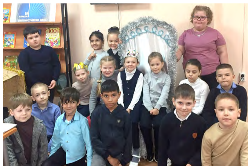
Михайловская детская библиотека им. Б.И. Вронского