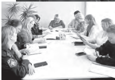
График приема граждан руководящим составом Администрации Железногорского района на май 2024 года