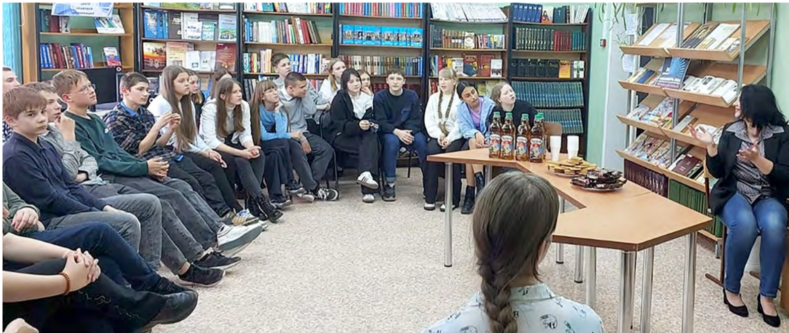
Михайловская центральная библиотека им. Н.М. Перовского