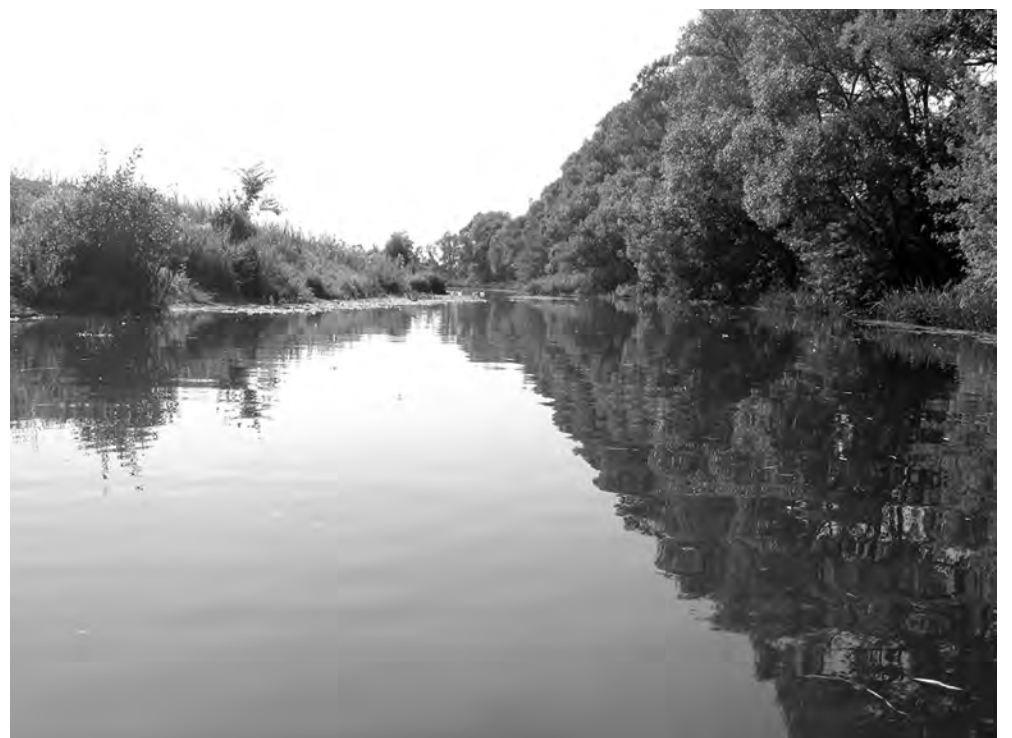
Река Усожа в районе с. Рышково