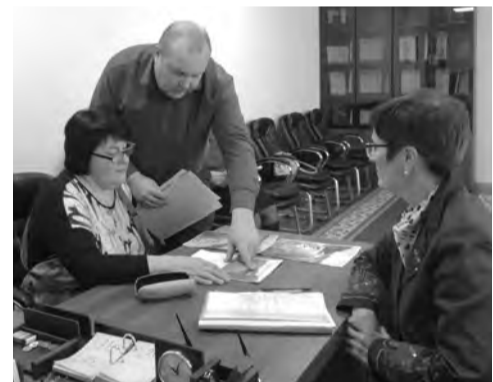
ГРАФИК ПРИЕМА ГРАЖДАН РУКОВОДЯЩИМ СОСТАВОМ АДМИНИСТРАЦИИ ЖЕЛЕЗНОГОРСКОГО РАЙОНА НА МАРТ 2024 ГОДА