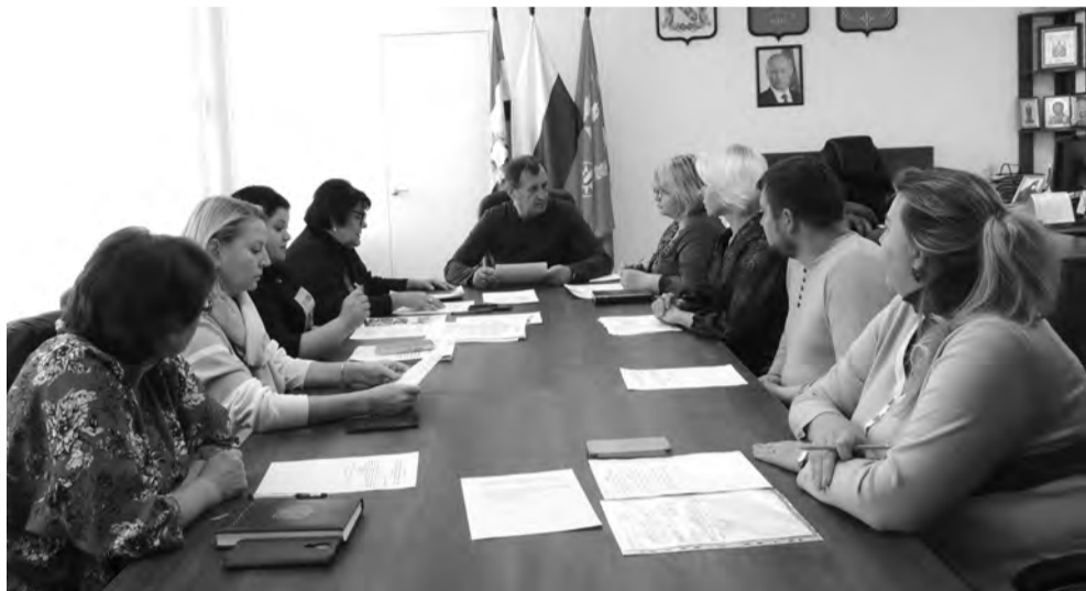
График приема граждан руководящим составом Администрации Железнодорожского района на ноябрь 2023 года