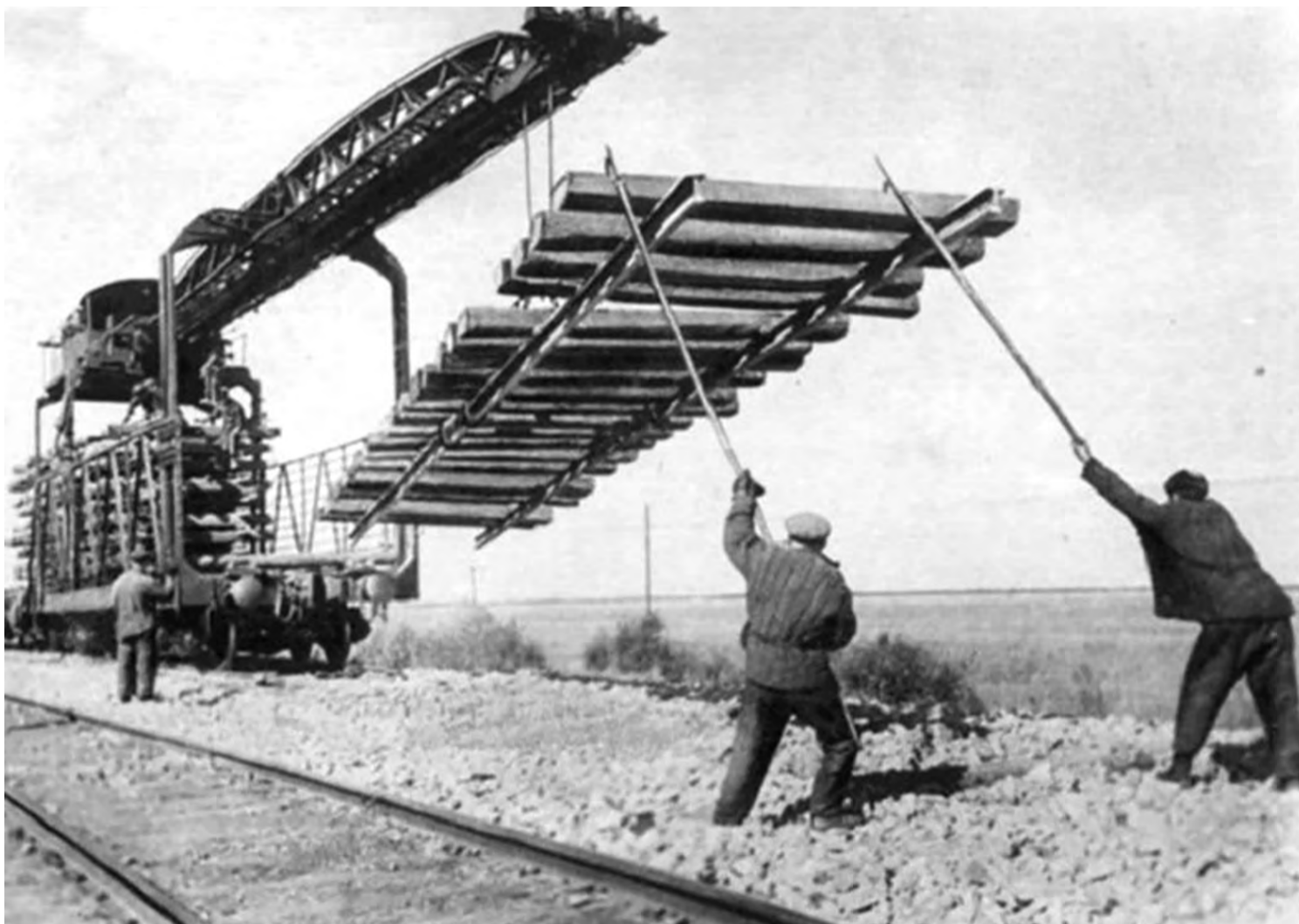
Строительство железной дороги