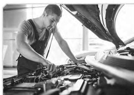
Поиск работы (54528 рублей)

По вопросу заключения социального контракта обращаться в Управление социальной защиты населения Администрации Железнодорожного района: г.Железнодорожск, ул. Ленина, д.52, каб.126, каб.131. Контактные телефоны: 8(47148) 2-64-86, 8(47148) 2-18-86.