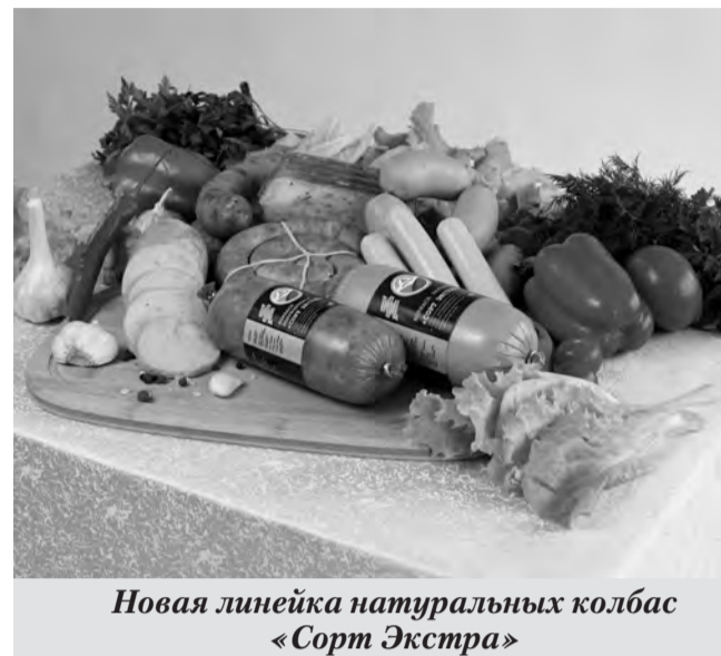
Новая линейка натуральных колбас «Сорт Экстра»