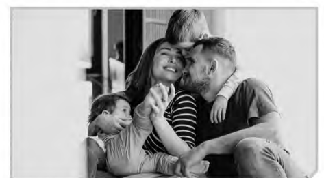
Преодоление трудной жизненной ситуации