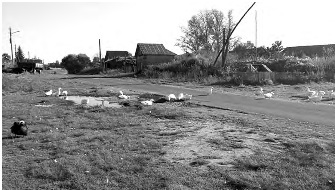
деревня Старый Бузец