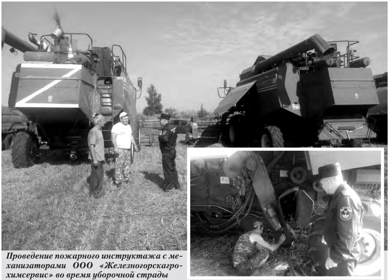
Проведение пожарного инструктажа с механизаторами ООО «Железнодорожно-агротехсервис» во время уборочной страды

- работа тракторов, самоходных шасси, ав-