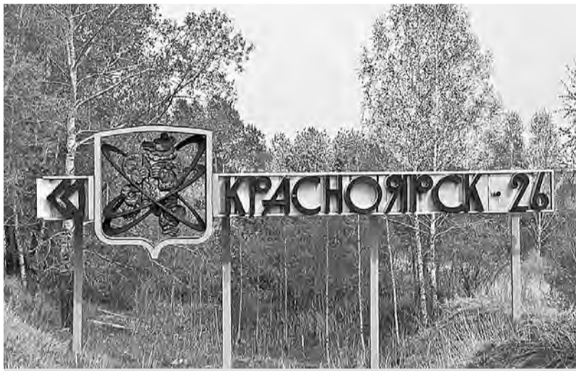
Герб сибирского Железнодорожска

и заключённые ГУЛАГа – исправительно-трудового лагеря (ИТЛ) «Гранитный». Само название о многом говорит. Вначале построили, пробив несколько тоннелей, железную дорогу протяжённостью 51 км. Затем начались горнопроходческие работы в скальном массиве, предназначенные для размещения ГХК. Что такое долбить гранит, навер-