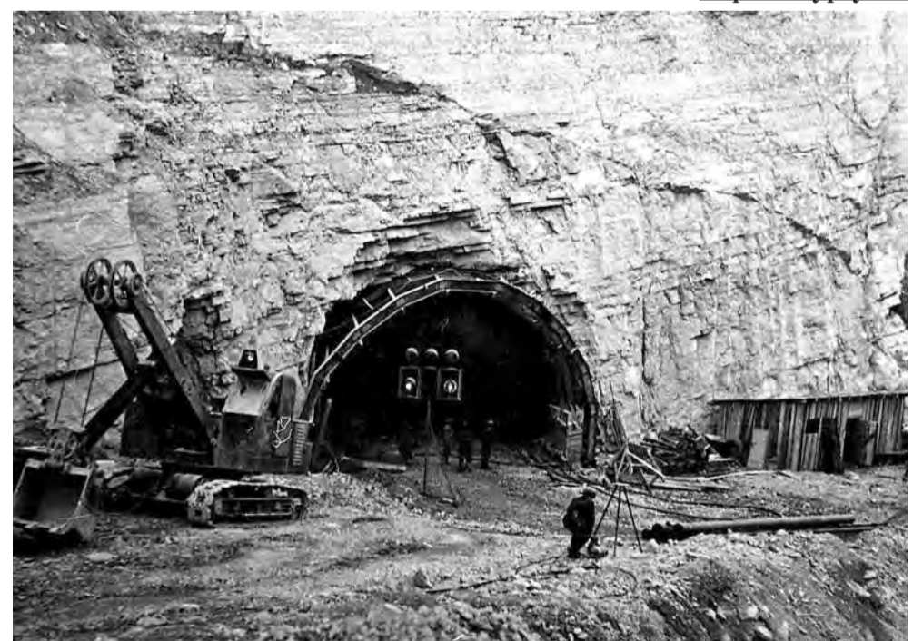
Вход в Горно-химический комбинат

но, даже представить непросто: настолько это изнуряющий физический труд. Со временем в окрестностях секретного объекта расположились более 10 ИТЛ с общей численностью заключённых около 70 тысяч человек. Горно-химический комбинат сдали в эксплуатацию в 1958 году. Он находится в горном массиве на глубине 300 м и может выдержать даже ядерные удары. Подземные залы похожи на станции метро, только значительно глубже, их высота достигает 55 метров.