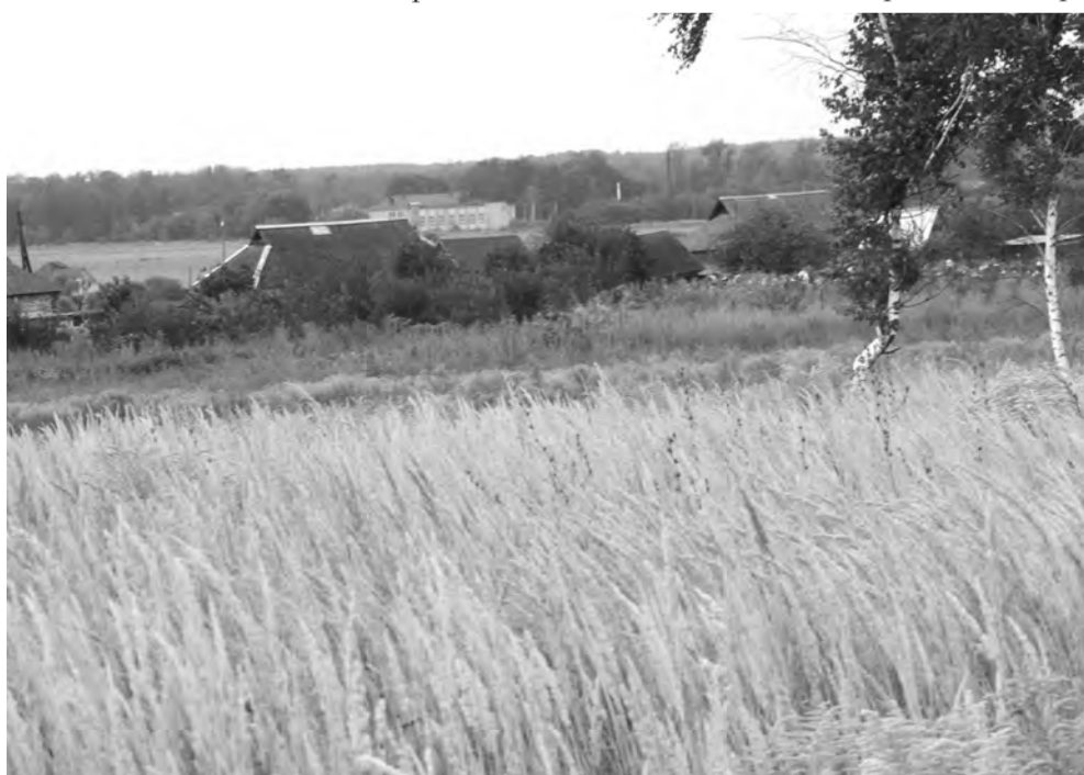
Вид на деревню Новый Бузец