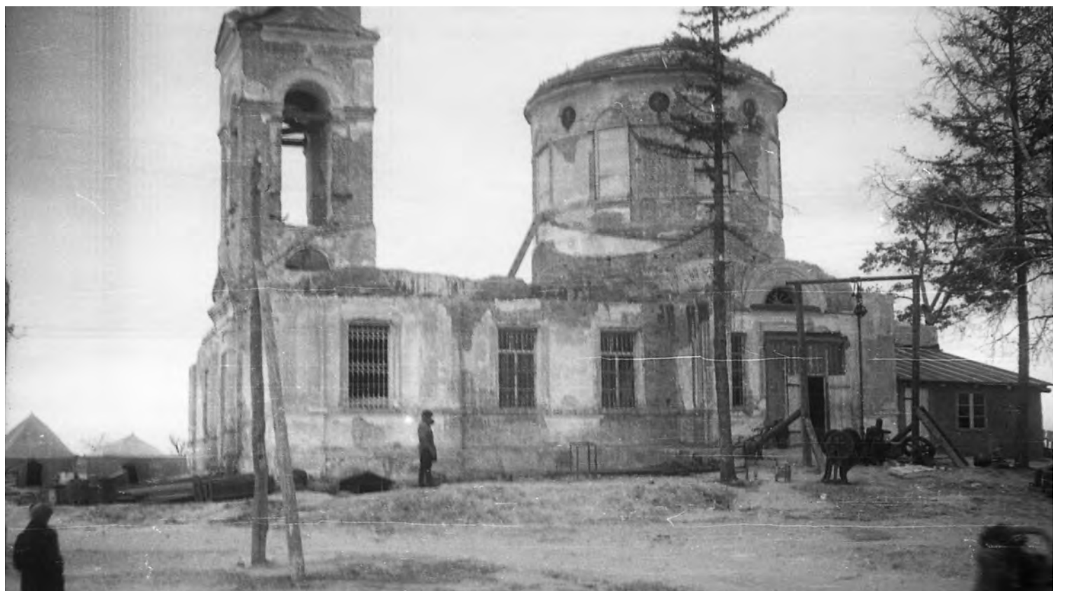
Богословская церковь. 1950 г.