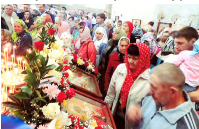
На 100-летию храма св.Параскевы Пятницы в с.Погорельцево. 2013 г.