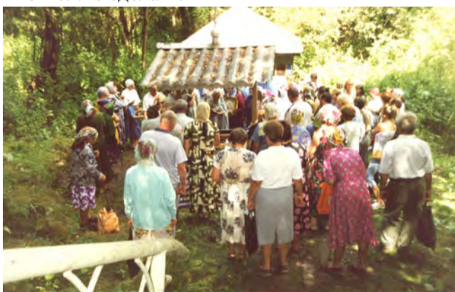
Св.источник иконы Казанской Божией Матери в д.Хлынино. 1999 г.

Для облегчения задачи работникам культуры и образования сверху спущены примерные планы и даже названия выставок и мероприятий. Многие из них общие, ни о чём: «К истокам народной культуры», «Традиций живая нить», «Из нас слагается народ»... Или, наоборот, узкие: «В каждом доме свои игрушки», «Гончарное ремесло»... Где взять столько мастеров в наших селениях? Проще сказать: их нет, отвязитесь. И всё же есть возможность провести немало мероприятий, разработав и утвердив свои, реальные, а не спущенные сверху планы. И пусть в каждом клубе, библиотеке будет не 15-20, а 5-6 мероприятий, но зато они реализуются. Вот мысли о том, что можно сделать.