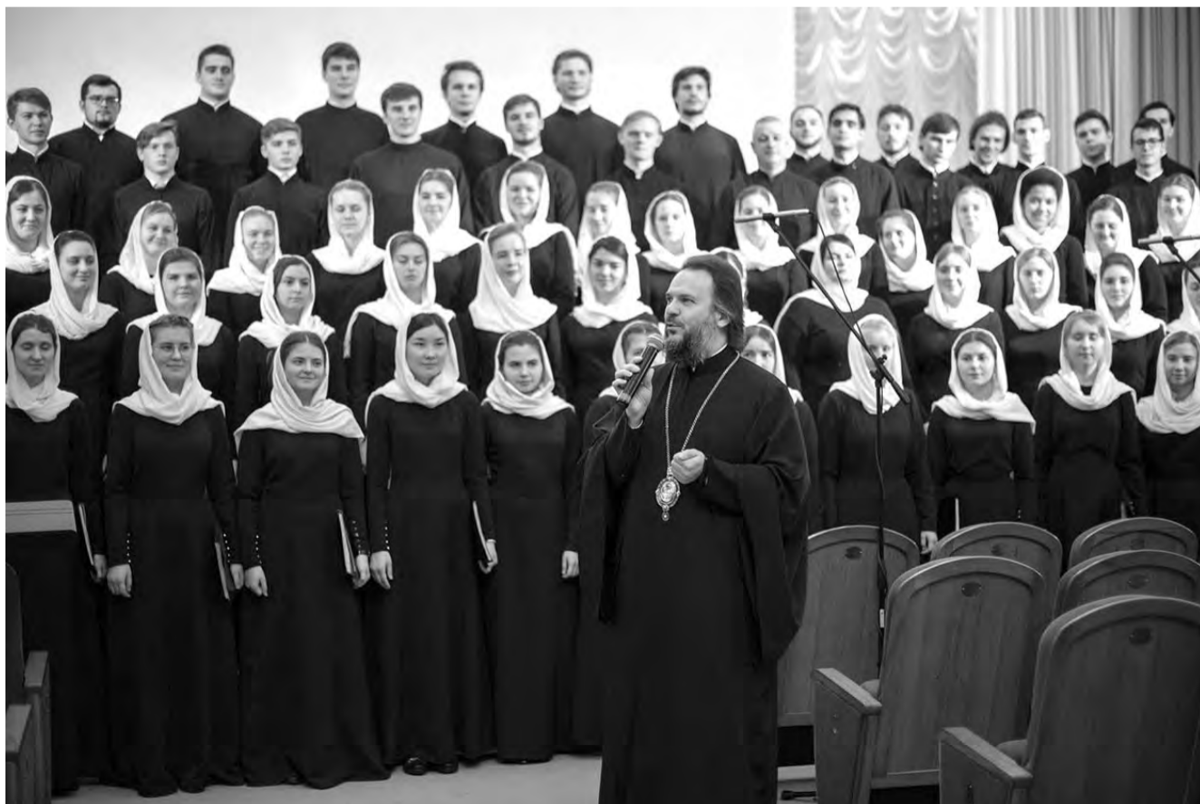
Епископ Амвросий с праздничным хором Донского монастыря

Когда заходит разговор о наших выдающихся земляках, железнодорожцы по праву называют в числе первых митрополита Амвросия.