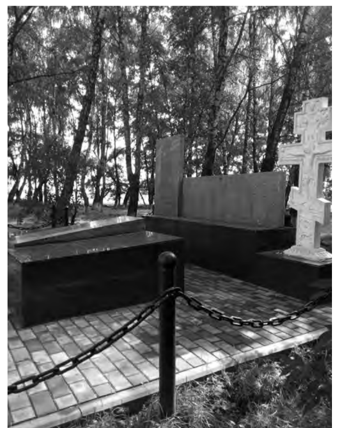
Памятник в Студенке