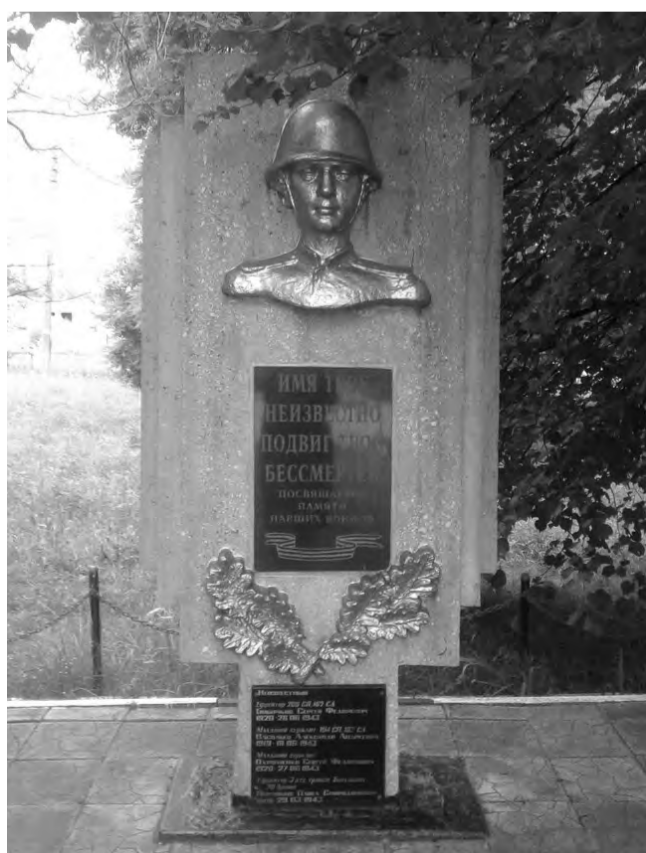
Памятник в Новоандросово