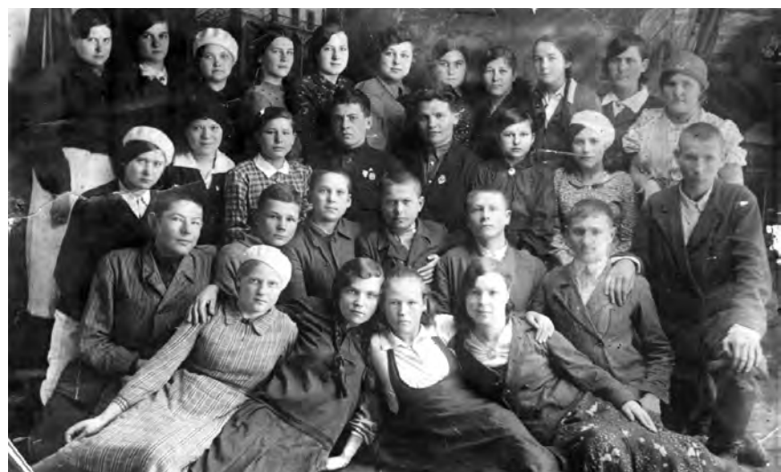
В Михайловке с одноклассниками, 1939 г.