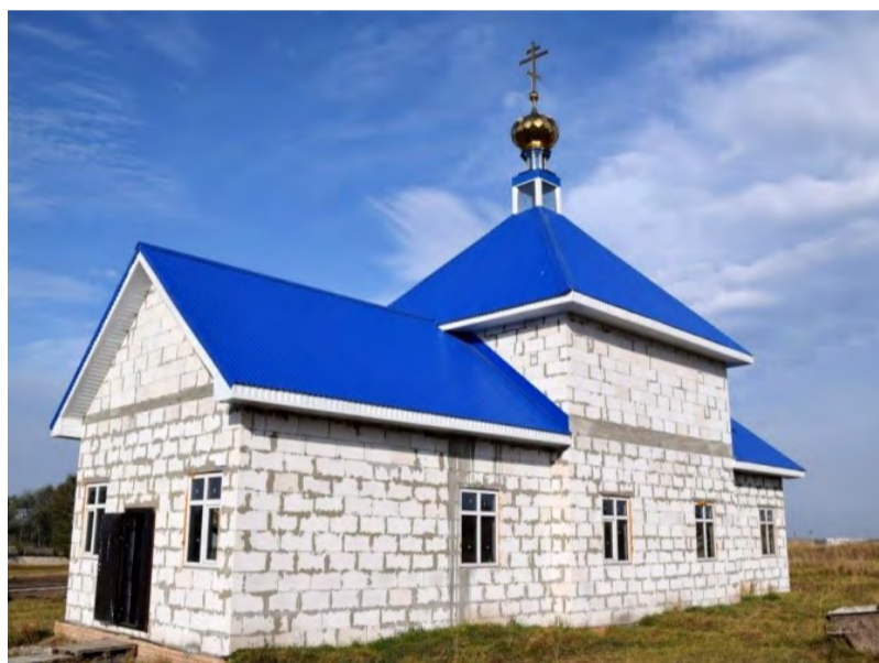
Храм в Разветье (п. Тепличный)