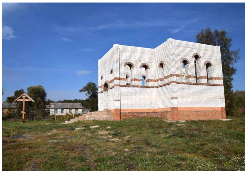
Храм в Копенках