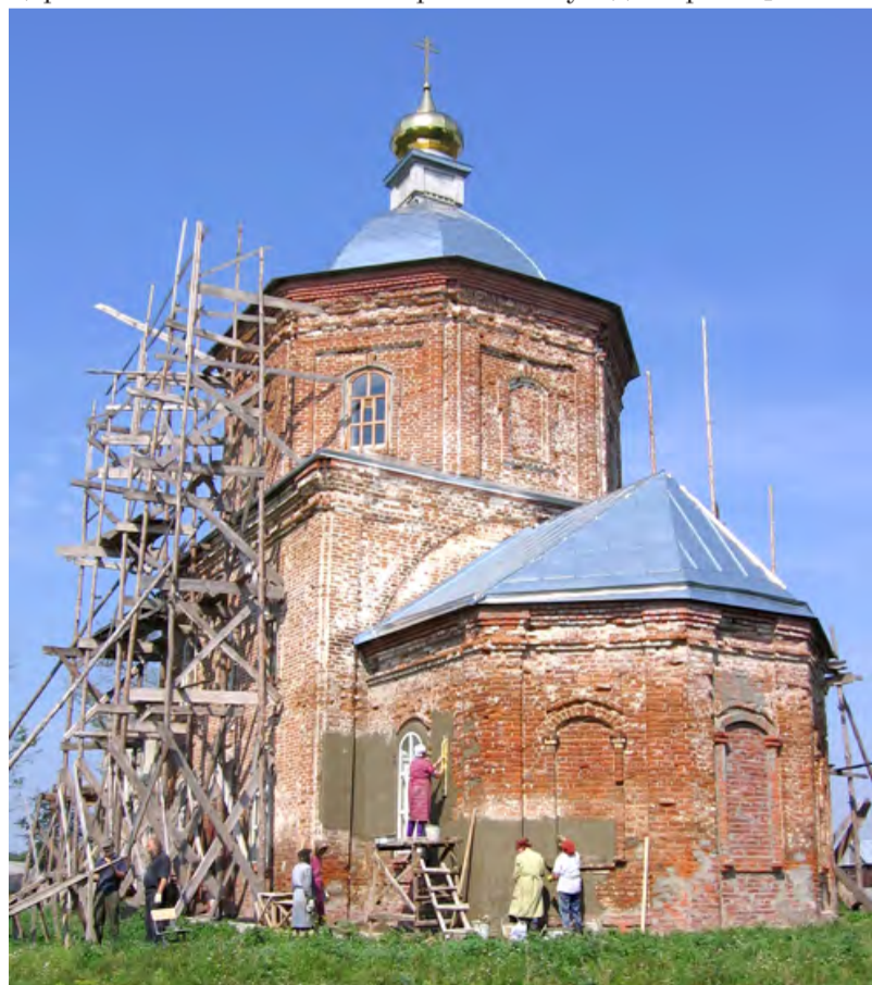
Возрождение храма Покрова в Жидеевке. Конец 1990-х гг.