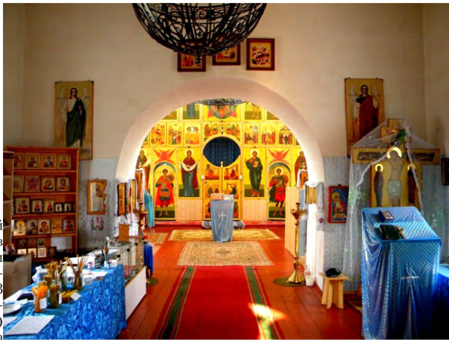
В Покровской церкви с. Жидеевка