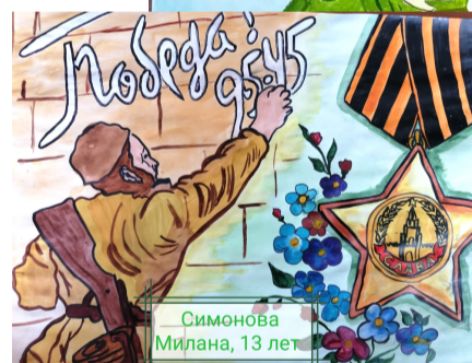
Симонова Милана, 13 лет

ОКНА САЙДИНГ ПОТОЛКИ ГИПСОКАРТОН ДВЕРИ скидки КРОВЛЯ до 70% ЗАБОРЫ 70% РАССРОЧКА - 0% 8-920-262-71-21 РАССРОЧКУ ПРЕДОСТАВЛЯЕТ ООО РУСФИНАНС БАНК ЛИЦ.1792 ОТ 13.02.2018Г