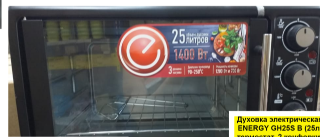
Духовка электрическая ENERGY GH25S B (25л, термостат, 2 конфорки)