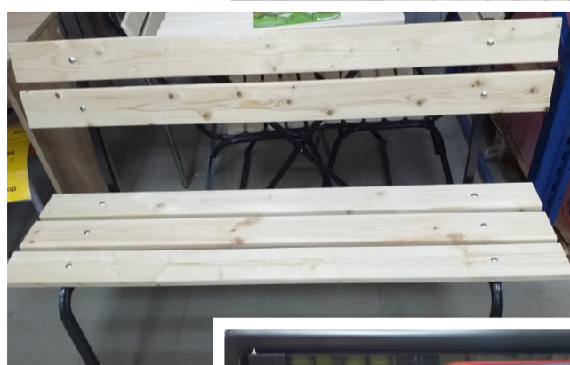
Скамья со спинкой Дачная стандарт 1,2м