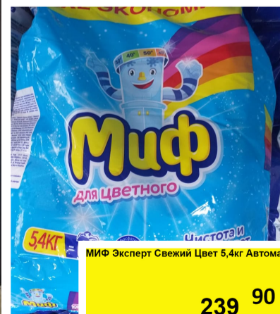
МИФ Эксперт Свежий Цвет 5,4кг Автомат