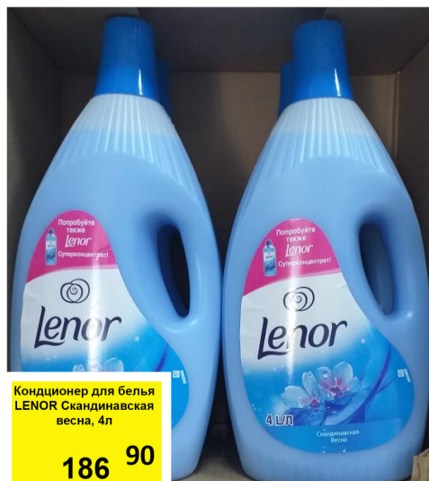
Кондиционер для белья LENOR Скандинавская весна, 4л