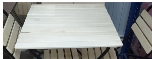
Набор садовой уличной мебели Престиж (стол складной и 2 стула) массив липа