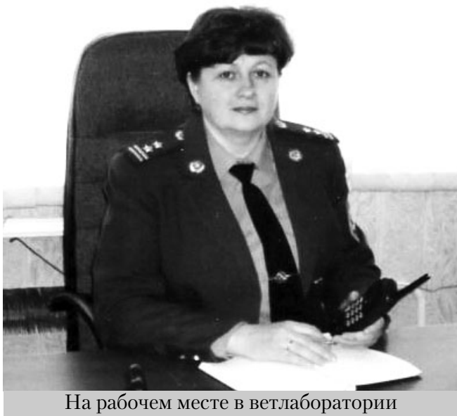
На рабочем месте в ветлаборатории

Владимировна подходит к выполнению работы.