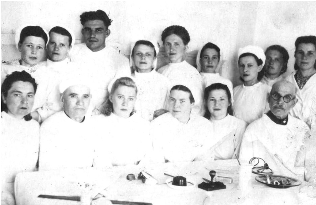
Коллектив районной больницы в 1954г.