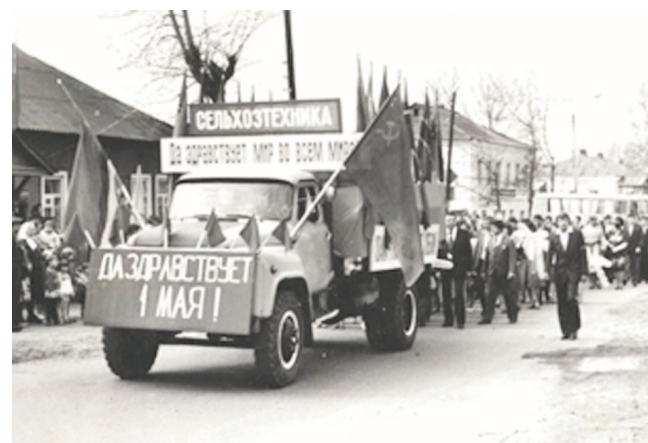
Первомайская демонстрация в сл. Михайловка