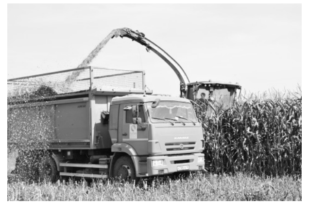
задействован один комбайн ЯГУАР, два трактора на трамбовке силосных ям, 12 КАМАЗов на перевозке.