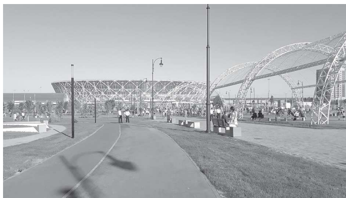
После ЧМ 2018 "Волгоград Арена" станет домашней ареной футбольного клуба "Ротор-Волгоград".

Свою главную задачу волонтеры обозначили так: помочь гостям мундиала сориентироваться на местности, подсказать, как пройти в нужное место и ответить на другие вопросы. Для этого в период подготовки пришлось подтянуть английский. Охрана на чемпионате в Волгограде была серьезная. Но главная задача стояла, чтобы силовики были меньше видны и при этом работали эффективно.